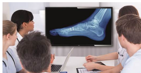
Imagen digital clínica

La imagen digital te ayuda a revisar y analizar imágenes clínicas con un rendimiento de visualización coherente y preciso. Para conseguir realizar interpretaciones clínicas fiables, nuestras pantallas profesionales se suministran calibradas de fábrica con el fin de ofrecer un rendimiento de visualización estándar en escala de grises optimizado. Gracias a la imagen digital, destacará en todos los aspectos del cuidado del paciente.